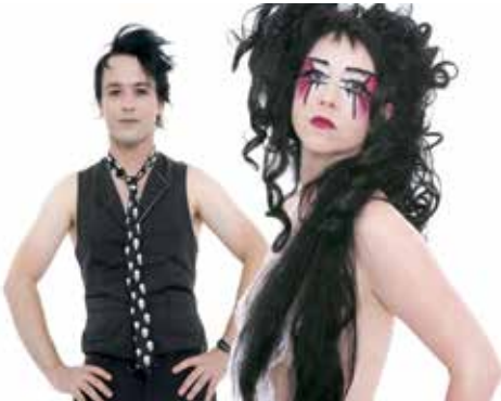
Duo Schneewittchen

stolz darauf war, die Entstehung der Welt aus dem Ich zu zeigen, wurde dieses vor Selbstbewusstsein strotzende „Ich“ allmählich brüchig, in der Romantik löste es sich auf, spaltete sich, kam abhanden, wurde bei Freud zu einer machtlosen Instanz im „psychischen Apparat“ und führt in