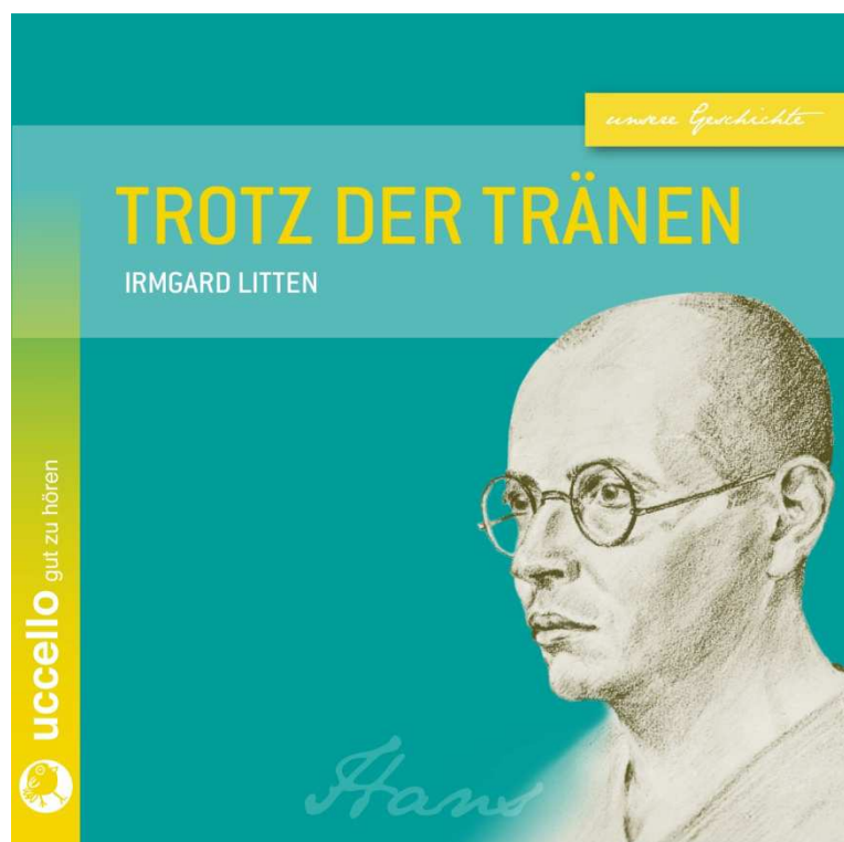
CD-Cover „Irmgard Litten – Trotz der Tränen“